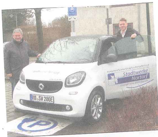
13 Unterwegs mit Strom - Stadtwerke mit Elektro-Smart

In Zukunft prüfen die Stadtwerke, ob Elektromobile auch in anderen Bereichen eingesetzt werden können. Auch die Infrastruktur für die E-Fahrzeuge stimmt in Nortorf: Die Stadtwerke haben bereits die ersten Ladesäulen installiert, und auch andere Unternehmen halten derzeit solche Säulen vor.